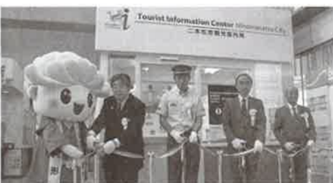
▲テープカットでオープンを祝う新野市長はじめ来賓の面々

二本松市では、増加する個人型旅行やインバウンド需要に因應するため、東北観光推進機構が進める「東北の観光案内所の整備・標準化」を受け、秋の観光シーズンを前にリニューアルを進めていた。