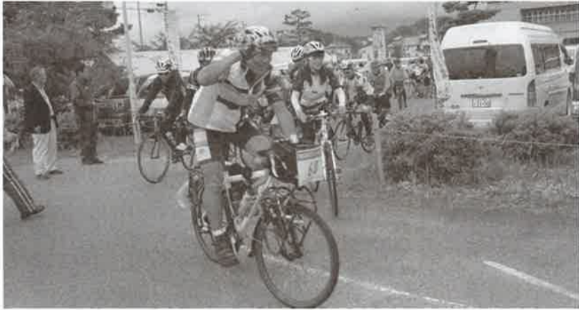
▶ 勢い良くスタートする参加者

コースは、阿武隈川沿いから智恵子大橋や稚児舞台、島山公園などの名所を巡る約四十キロのアスリートコースと、親子で楽しめる約二・五キロのファミリーコースの二種目。台風の影響もあり、途中からあいにくの雨だったが、参加者は思い思いのペースでゴールを目指した。到着した順に主催者側からさくさくが振る舞われ、参加者からは心身ともに温まると喜ばれた。