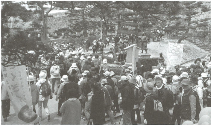
▲霞ヶ城公園 箕輪門からスタートする参加者の皆さん

編集発行所 二本松商工会議所 〒964-8577 福島県二本松市本町一丁目60-1 TEL(0243)23-3211 FAX(0243)23-6677 E-mail:ncci@nihonmatsu-cci.or.jp URL:http://www.nihonmatsu-cci.or.jp