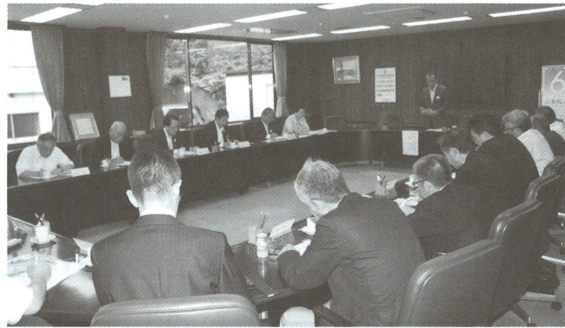
▶講話する新野市長

安達地方商工会等連絡会議(石澤孝代表幹事)は、六月十一日午後四時から二本松商工会議所で開催され、あだたら・本宮市・大玉村商工会の各正副会長、事務局長と当所正副会頭等が出席して開催された。 最初にゲストの新野洋二本松市長が「安達地方の連携について」と題して講話した。新野市長は、「安達地方には、桜や温泉、観光資源など隠れた魅力がいっぱいある。人口の減少は気になる所だが、安達地方の三自治