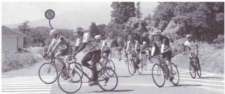
◀安達太良山を背に心地良く走行

沿いの43キロのアスリートコースのほか、今年から親子で楽しめるように20キロのファミリーコースを楽しんだ。 コース途中には、主催者が用意した休憩所に地元野菜のきゅうり・リンゴ、飲料水などが振る舞われ、心のこもった「おもてなし」で接待を受けた。 ゴール後の閉会式では、全員にあたる抽選会が催され、岳温泉ペア宿泊券は、福島市から参加した男性に石澤会頭からプレゼントされた。