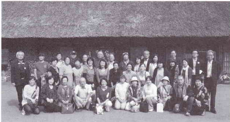
▶ 白川郷の荻町合掌集落前にて集合写真

日かかったが、参加者は疲れも見せず、宴会に温泉にダンスショーと楽しんだ。2日目は、中部電力小坂発電所の視察、飛騨高山、飛騨まつりの森と巡った後、遂に本ツアー最終目的地である白川郷の荻町合掌集落に到着。日本の原風景が残る美しい景観の中に佇む茅葺屋根の大きな合掌造りの家々を見て回り、最後に全員で記念撮影をして帰路についた。