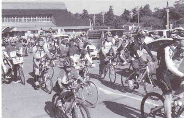
▲元気良くスタートをきる参加者

〒964-8577 福島県二本松市本町一丁目60-1 TEL(0243)23-3211 FAX(0243)23-6677 E-mail:nccci@nihonmatsu-ccior.jp URL:http://www.nihonmatsu-ccior.jp