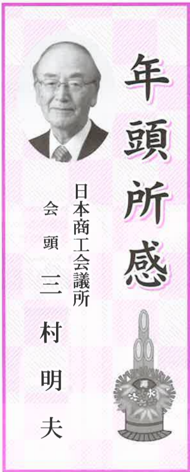
日本商工会議所 会頭 三村 明夫

に協力いただいた関係各位に厚く御礼申しあげます。中小企業は、単なる相続の問題ではなく、世代交代による中小企業の活性化、生産性向上、地方創生など、わが国経済の成長に関わる大変重要な課題であります。今後5年間で団塊世代の経営者30万人が70歳に到達する「大企業承継時代」を迎える中で、商工会議所として、事業承継税制をはじめ、国の施策をフル活用し、わが国経済を支える中小企業の円滑な事業承継を後押ししていく必要があります。