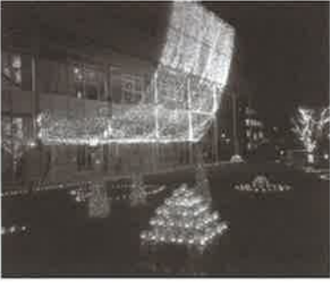
▶ 幻想的な雰囲気にも包まれた二本松市市民交流センター

当日は、二本松市長をはじめ、二本松警察署長、当所山口会頭らが来賓として招かれ点灯式に参加した。青年部のメンバーはイルミネーションの点灯に合わせ