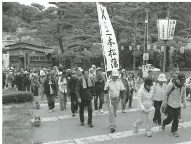
▲二本松健康歩こう会の先導でスタート

■URL: http://www.nihonmatsu-cci.or.jp ■E-mail: ncci@nihonmatsu-cci.or.jp