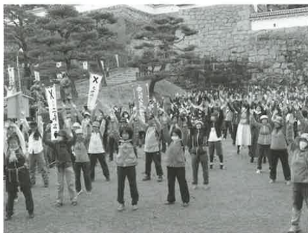
▲出発前にラジオ体操で体をほぐす参加者

二本松市内の桜の名所や霞ヶ城公園・寺院などを訪ね歩き、城下町の春を楽しむ「春爛漫*ちよつとぶらりさくらウォーキング」は四月十五日、県立霞ヶ城公園の箕輪門前を発着点に開催され、県内外からの一般参加者とJICA二本松訓練所で学ぶ青年海外協力隊候補生合わせて約三〇〇人が参加した。今年も戊辰の役から一五〇年目の年にあたることから、戊辰の役一五〇年記念事業と位置づけ、二本松少年隊の歴史を傳承することを目的に加え実施した。二本松商工会議所・同業委員会・にほんまつ地球市民の会の主催でにほんまつ観光協会の共催。