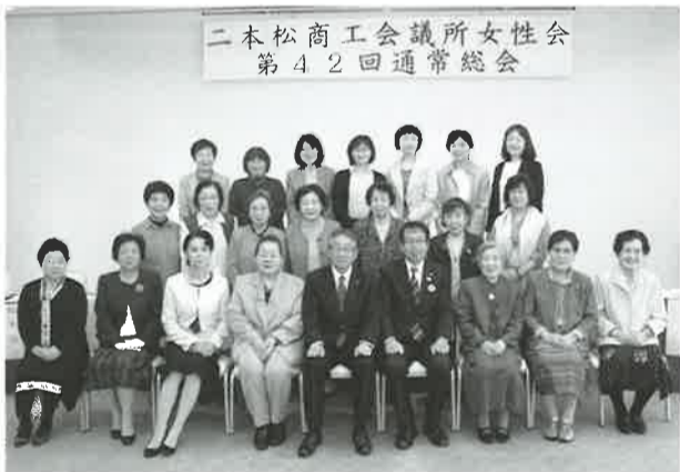
二本松商工会議所女性会 第42回通常総会

謝申し上げます。今年度は会員の『健康』をテーマにセミナー等開催し、元気で活発な女性会運営をしていければ、皆様の多大なるご協力を今後ともお願い申し上げます。」と挨拶があった。平成二十九年事業報告・収支決算並びに平成三十年事業計画・収支予算、二本松商工会議所女性会会費に関する規