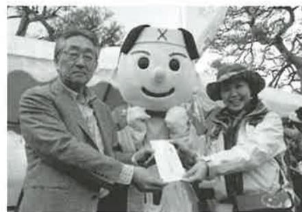
▲岳温泉ペア宿泊券をゲットした参加者

ゴール後は、郷土料理の「ゆづり」が振る舞われた。他、岳温泉宿泊券や共通商品券、地酒など豪華景品が当たるお楽しみ抽選会が行われた。