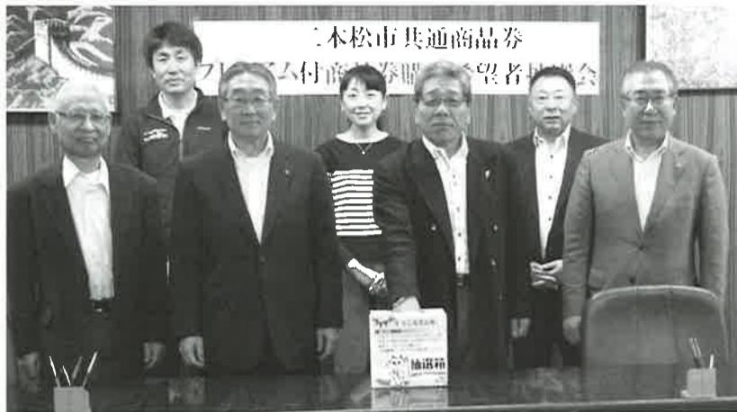
▲山口会頭、平館委員長らが厳正に抽選を行った

平成十七年十一月から発行を開始した二松市共通商品券は、現在市内の加盟店二九三店で利用できる。当選者の発表は返信はがきの発送をもって代えさせていただきます。多数ご応募頂き誠にありがとうございます。