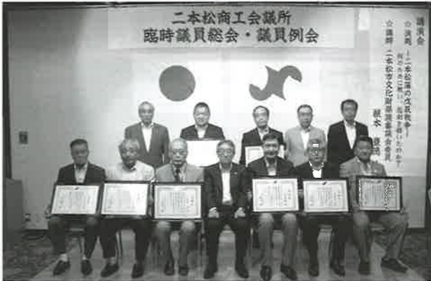
▶山口会頭(中央)が総会内で感謝状を伝達した。