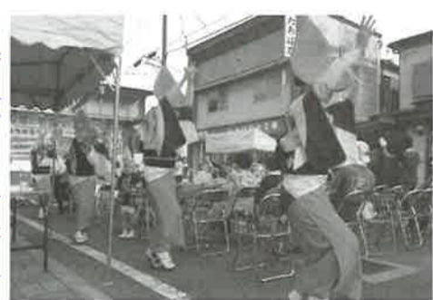
▶ 若宮夏まつりでは阿波おどりが会場を賑わせた

つりには、恒例の豪華景品が当たる大抽選会が行われ、多くの市民で賑わいを見せた。八月十一日には、本町商店街開