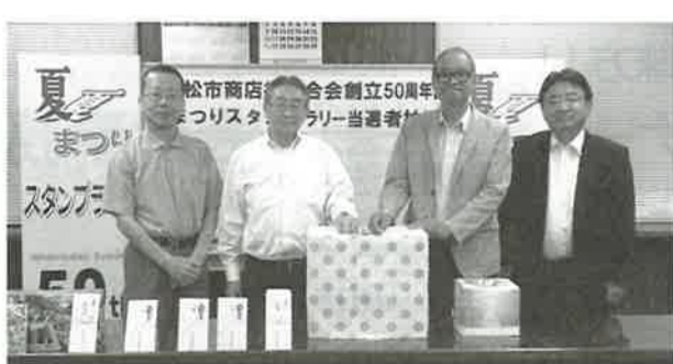
▶ 山口会頭（中央左）、渡辺商連会長（中央右）らが、厳正に抽選を行った。