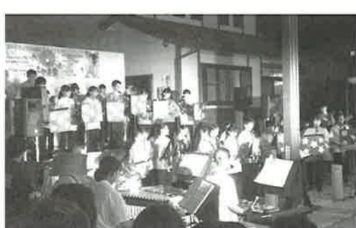
▶ 根崎夏まつりで演奏する安達高吹奏楽部のみなさん

よるミニコンサートや安達高校吹奏楽部の演奏のほか、東北サファリパークのさる劇場の登場、根崎若連会による祭囃子が披露されるなど大盛況であった。