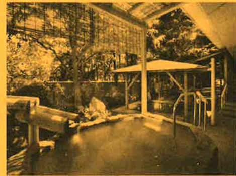
岳温泉ペア宿泊券