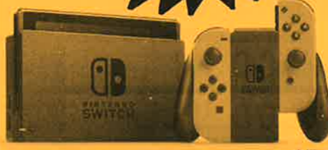
Nintendo Switchのロゴ・Nintendo Switchは任天堂の商標です