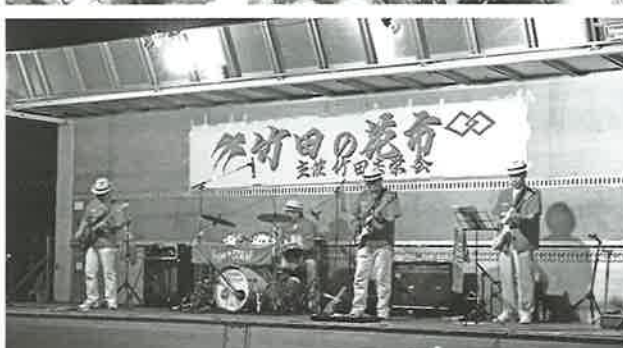
▶ 安達高生の音色が響いた根崎夏まつり