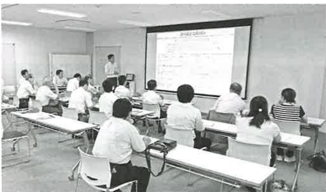
▲(株)デンソー福島で説明を受ける視察参加者

参加者は、グローバル企業によるものづくりの最先端工場での取り組み、教育者側から見た人材確保への考え方、商品開発・研究への技術支援環境などの説明に、自社での参考とすべく熱心に耳を傾けていた。