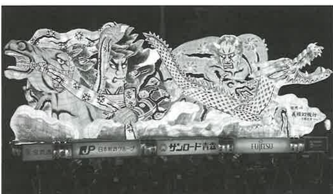
▲青森の夏の夜に煌々と輝くねぶた

ねぶた祭りが始まると、初めて見る色鮮やかなねぶたに皆感嘆の声をあげていた。どのねぶたも製作者たちの熱い思いの詰まったもので、目で見ると色彩や形の表現、囃子方が叩く太鼓の音の振動とで、生で見る