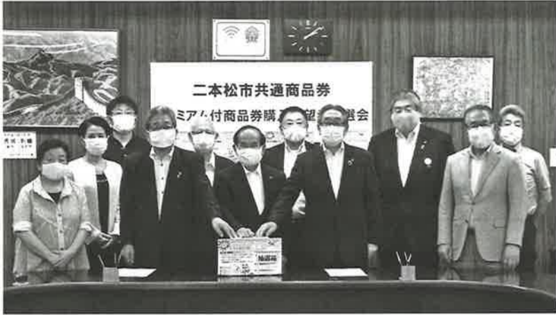
▲三保市長、山口会頭ほか委員会メンバーが厳正に抽選を行った

編集発行所 二本松商工会議所 〒964-8577 福島県二本松市本町一丁目60-1 TEL (0243) 23-3211 FAX (0243) 23-6677