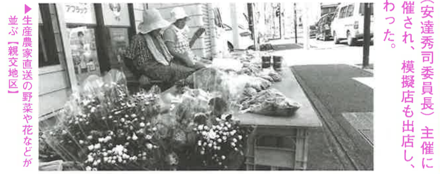
▶生産農家直送の野菜や花などが並ぶ【親交地区】