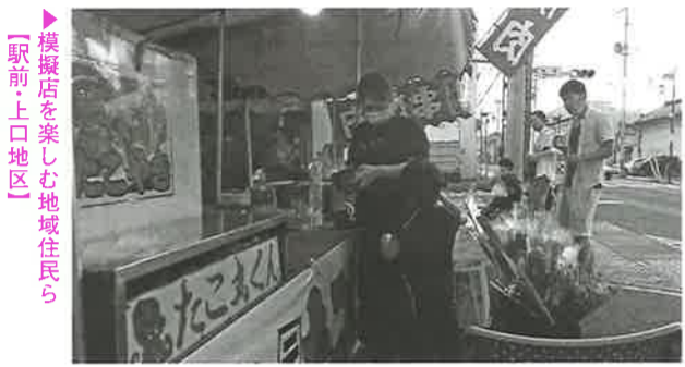
▶模擬店を楽しむ地域住民ら 【駅前・上口地区】

本町商店街開発協議会（安達秀司委員長）主催による「もとまちは花市」が開催され、模擬店も出店し、地域住民らが緑日気分を味わった。 八月十一日（火）、お盆を前に本町通りにおいて「もとまちは花市」が開催された。本イベントは本町商店街開発協議会主催によるもので、例年八月十一日は同会主催による夏まつりを開催しているが、今年は新型コロナウイルス感染症の影響により中止となったため、それに代わるイベントとして規模を縮小した形での花市として開催した。 当日は、本町通りの各地区で飲食や花を購入できる模擬店などが出店し、花を買い求めにきた人や地域住民らが緑日気分を味わった。