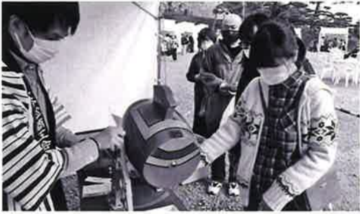
▲商品券が当たる福引きも行われた