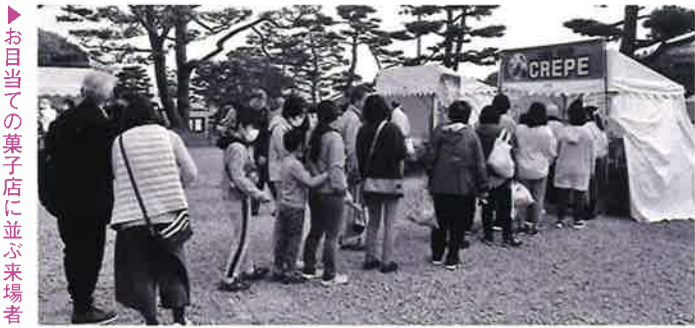
▶お目当ての菓子店に並ぶ来場者

当商工会議所が主催の「にほんまつ菓子博」が、十一月七日から八日にかけて霞ヶ城公園で開催された。新型コロナウイルス感染症感染拡大対策として屋外で初の開催となった。 この菓子博は二本松の菓子の魅力を広くPRし、消費拡大とブランド化の促進を図ろうと企画したもので、今回で四回目の開催となる。「霞ヶ城公園菊花展」と同会場ということもあり、市内外から二日間で四千人以上の方々が訪れ、二本松伝統の和菓子や人気の洋菓子を堪能した。 会場には、二本松の菓子