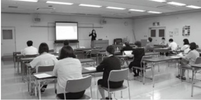
▲ 熱心に講演を聞く参加者

補助金について説明した後、現在話題となっている『事業再構築補助金』について、詳しく説明した。事業再構築補助金はポストコロナ・ウィズコロナ時代に対応するため、思い切った事業再構築に意欲を有する企業を支援することを目的としており、予算・補助金額ともにこれまで例のない規模での補助金であるため、活用する価値はあると講演し、参加者は熱心に聞き入っていた。