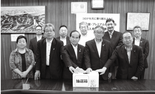
▲ 三保市長、山口会頭ほか委員会メンバーが厳正に抽選を行った

当選者の発表は返信はがきの発送をもって代えさせて頂きました。多数ご応募を頂き誠にありがとうございました。