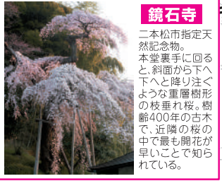
鏡石寺 二本松市指定天然記念物。本堂裏手に回ると、斜面から下へ下へと降り注ぐような重層樹形の枝垂れ桜。樹齢400年の古木で、近隣の桜の中で最も開花が早いことで知られている。