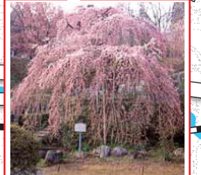
本久寺 慶安2年(1649)日相和尚が開山。本堂南東に大きく傾斜した土手際に寛永20年(1643)植樹と伝える市指定天然記念物シダレザクラの古木。根元周囲2.7m、目通り幹囲3m、樹高約9m、枝張りは東西に約14.5m、南北に17m推定樹齢約350年。ライトアップされた夜桜はその美しさに時を忘れる。