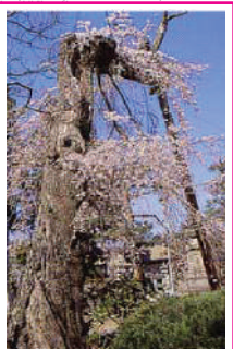
長泉寺 当地方真言宗の地方本山格。享保3年(1718)建立尊身仏の地藏菩薩、延享4年(1747)建立の石造大宝塔など石仏・石塔が多い。