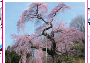
蓮華寺 二本松市指定天然記念物。江戸彼岸系の枝垂桜。推定樹齢360年。桜名所人気スポットの一つ。