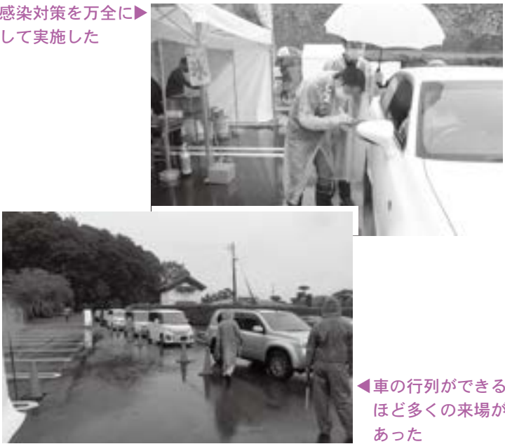
感染対策を万全に▶ して実施した