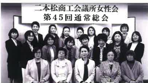
▲記念撮影する女性会メンバー

本年度事業としては、リデュース・リユース・リサイクルの3R活動を主軸としたエコ活動の実施、会員の資質向上のためのセミナー等の開催、フラワー事業（菊いかだ等菊関連事業）、クウエート国の料理教室、家庭用食用油回収事業、エコキャップ・プルタブ回収事業の実施、福島県商工会議所女性会連合会研修会、東北六県商工会議所女性会連合会総会弘前大会、全国商工会議所女性会連合会福島全国大会への参加、親会である二本松商工会議所諸事業への参加協力