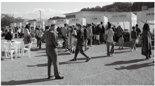
▲ 多くの来場者で賑わう会場

を重ねられた。また、公共の福祉に寄与するとともに、事業の社会的、経済的地位の向上および会員相互の連絡協定の緊密化に貢献し、産業界のみならず地域社会の発展と安定のために尽力された。 副会頭の他、二本松青年会議所理事長、(社)福島県トラック協会理事、福島県物流ネットワーク協同組合代表理事、二本松地区警察官友の会副会長、日本赤十字社福島県支部安達地方有功会会長、二本松市自衛隊協力会会長、同顧問、福島県自衛隊協力会連合会監事等の要職を歴任してきた。 これら長年にわたる産業振興への功績が認められ、この度の旭日双光章受章となった。