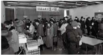
▲大勢の来場者で賑わう会場

験もあり、来場者が購入した菓子と一緒にお茶を楽しんでいた。別会場では、上生菓子や大福などの菓子作り体験が行われ、延べ約五十人が参加した。体験には、親子で参加する姿も多く見られた。参加者は、菓子職人の指導を受けながら、熱心に取り組んでいた。