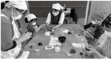
▲菓子作りに真剣に取り組む参加者