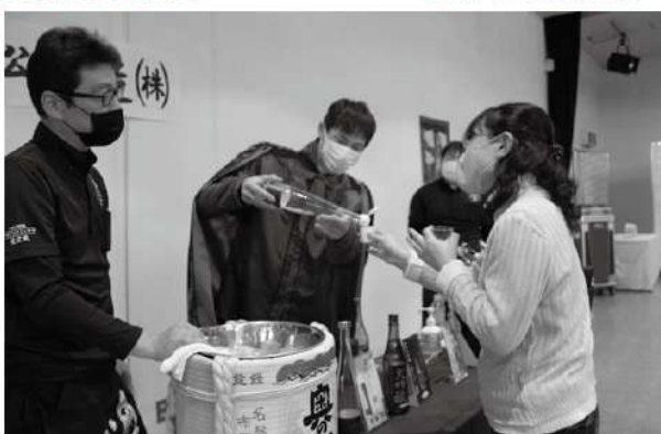
▲ 日本酒王子らとの交流もあった

本松市が誇る奥の松酒造、大七酒造、人気酒造、檜物屋酒造店の地酒の魅力を広げ発信し、消費拡大