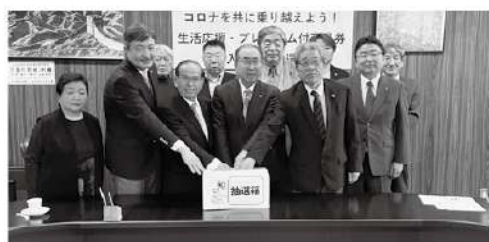
▲ 三保市長、菅野会頭ほか委員会メンバーが厳正に抽選を行った