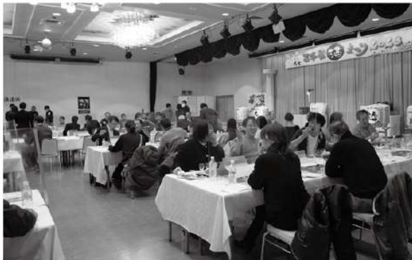
▲ おつまみ折詰とお酒を愉しむ参加者

当商工会議所が主催の「二本松酒まつり」が、二月十一日に二本松御苑で開催され、市内外から集まった一六〇人の日本酒ファンらが二本松の美酒に酔いしれた。このイベントは、二