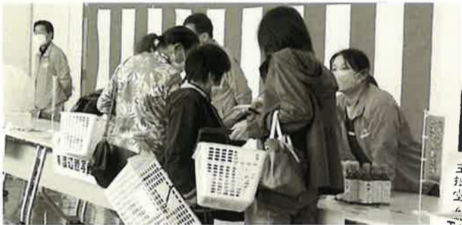
▲ 多くの来場者で賑わった

抽選券を配布し、お米や枕、お菓子の詰合せなど、各店おすすすめの豪華景品が当たる空くじなしの抽選会も実施し、近隣住民や観光客など、多くの方が来場していた。二本松一店逸品研究会は、今後も更なる一店逸品運動の展開を計画している。