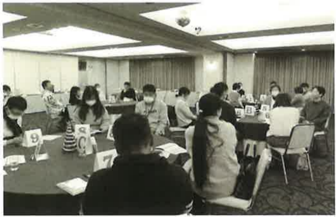
▲ 交流を深めた参加者たち

講後は、自己紹介タイム、一対一のトークタイムとなった。参加者は、プロフィールカードを基に、趣味や好きな食べ物、物の話などで、一回四分の一対一のトークタイムを有意義に過ごしていた。