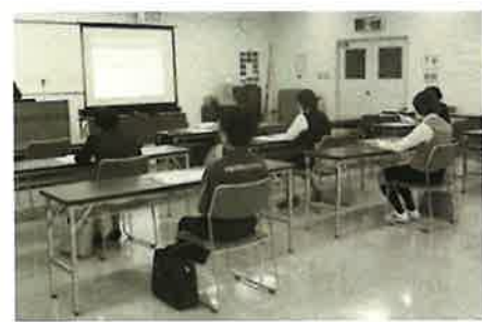
▲ 熱心に講演を聞く参加者

当商工会議所は八月二十二日、「制度改正等の課題解決環境整備事業」講習会を開催した。 社会保険労務士シグマ総合事務所代表の赤澤将(あかさわ まさる)氏を講師に招き、「働き方改革関連法の対応ポイント」を演題に据え、八名が参加した。 冒頭、赤澤氏からは働き方改革の目的について解説がなされ、その後はこれまでの法改正のポイントを四つのセクションに分けて説明が行われた。具体的な内容は次のとおり。 ① 年次有給休暇の罰則付き強制付与制度 ② 労働時間の上限規制 ③ 同一労働同一賃金 ④ 改正育児・介護休業法