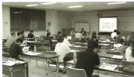
▲ 熱心に公演を聞く参加者