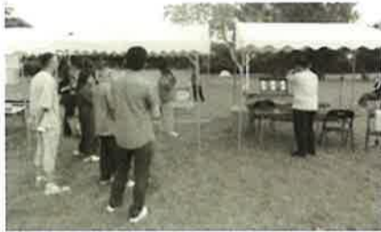
▲ 交流を深めた参加者たち

編集発行所 二本松商工会議所 〒964-8577 福島県二本松市本町一丁目60-1 TEL (0243) 23-3211 FAX (0243) 23-6677