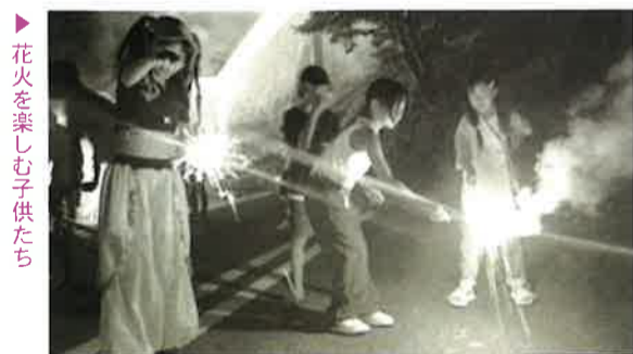
▶ 花火を楽しむ子供たち

により消費拡大や宣伝、飲食ブースは市内事業者へ出店依頼し二本松市内の経済活性化に寄与することも目的の一つとした。メインステージでは、フェイスタストリートによるダンス披露や平兄弟、吉田チキン、ミッチーチェン、ave (エイヴ) によるライブパフォーマンスが行われ、会場を盛り上げた。