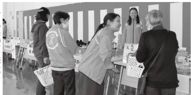
▶多くの来場者で賑わった

当日は、一年間、各店が悩みに悩んだ末に決定した、今年度のこだわりの商品「逸品」をお披露目し、日用品や和菓子、加工食品、木工品、アクセサリーなど、各事業所よりすぐりの逸品を販売した。また、購入金額千円毎に一回、お米や枕、お菓子の詰合せなど、豪華景品が当たる空くじなしの抽選会も実施し、近隣住民や観光客など、多くの方が来場していた。二本松一店逸品研究会は、今後も更なる一店逸品運動の展開を計画している。