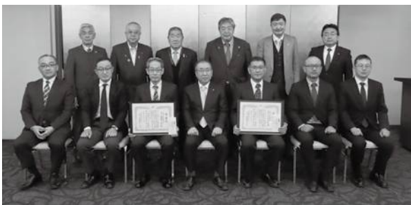
▲感謝状を受け取った退職者・転勤者の皆様