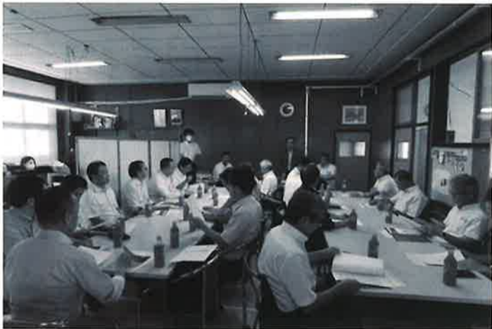
▲熱心に説明を聞く参加者