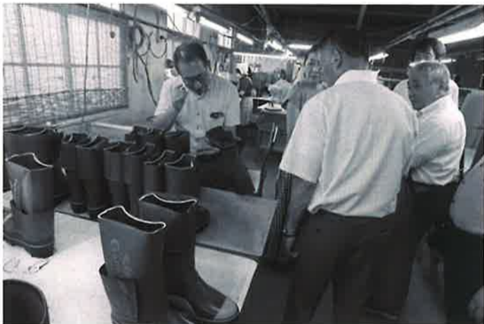
▲製作過程の長靴を見る参加者

当商工会議所は、九月二十日、地域を代表する企業・地域密着をコンセプトに掲げる、当商工会議所常議員でもある東邦ゴム工業(株)の工場視察訪問を実施した。 当日は、役員二十五名が参加し、東邦ゴム工業(株)本郷代表取締役社長他、職員の案内により三班編成で総ゴム靴製品製造の工場内を視察。合成ゴムの塊を巨大な切断機で裁断し、様々な成分を配合して機械で練り合わせている工程や、板状に伸ばしたゴムを長靴の各パーツに型抜きし裁断、プレスする金型等、参加者は熱心に見学をした。 創業以来ゴム長靴を製造し続け、警察や消防など特殊作業長靴の国内シェアで八十%を占める「無敵くん」は、地震・津波などの天災に加え、原発事故においても捜索隊の足元を守るなど大活躍をした商品である。 このように国内履物メーカーが次々廃業する中で生き残り、堅実な物づくりをする会社が、我がまち二本松に存在することを誇りに思い、視察終了後には、参加者で懇親を大いに深めた。