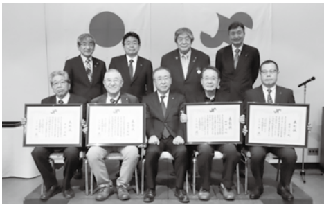
▲感謝状を受け取った受賞者ら

証を踏まえ、経済活動の回復と新たな環境変化に重きを置き、組織・財政基盤の強化に努めるとともに、地元事業者の「経営基盤の強化」と持続性のある「地域の活性化」の実現に向けて積極的に各種事業を展開する。 先ず「経営基盤の強化」においては、巡回相談・専門相談を各種経営支援事業の核とし、会員事業者の声を聞き、ニーズに即した支援の実施。高齢化や人手不足などの社会的課題については、事業承継や創業者支援、IT化によるDX支援やデジタル社会への適応支援など、更なる経営支援の充実を図る。また、働き方改革及び社会保障などの諸制度に対して、即応できる体制の強化を図り、労働環境改善並びに健康経営に注力する。 次に「地域の活性化」においては、これまで開催してきた「さくらウォーキング」、プレミアム付商品券発行事業、「菓子博・酒まつり」、「スタンブラリー」などの事業を継承し、持続性のある戦略として、誘客の促進と地域経済の活性化推進のための取組み、地域の特性と匠の技を活かした地場産品のブランド化も推