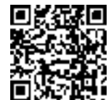
ふるさと納税返礼品提供事業者 募集二次元コード

事業者の要件など詳細は、ウェブサイト（右記の二次元コード）をご確認いただくか、市役所秘書政策課までお問合せください。