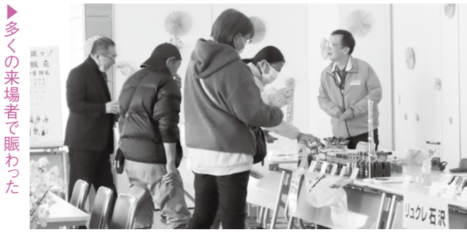
▶多くの来場者で賑わった

象徴する一押し商品やおすめを逸品としてアピールし、事業所への関心を高め、気軽に来店してもらおうきっかけをつくるのが狙い。 おひろめ販売会当日は、一年間、各店が悩みに悩んだ末に決定した、今年度のこだわりの商品「逸品」をお披露目し、日用品や和菓子、加工食品など、各事業所よりすぐりの逸品を販売した。また、購入金額千五百円毎に一回、お米や枕、お菓子の詰合せなど豪華景品が当たる空くじなしの抽選会も実施し、近隣住民や観光客など多くの方が来場していた。 二本松一店逸品研究会