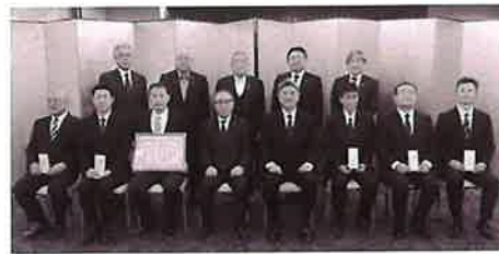
▲感謝状を受け取った退職者・幹部転勤者の皆様